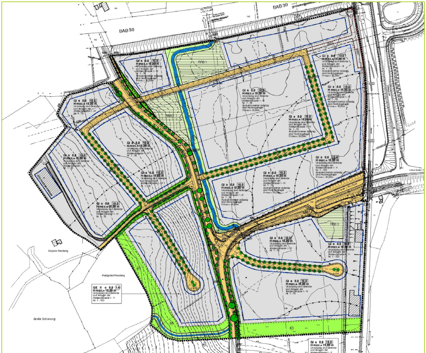
Bebauungsplan (BauGrund/Wolters Partner)